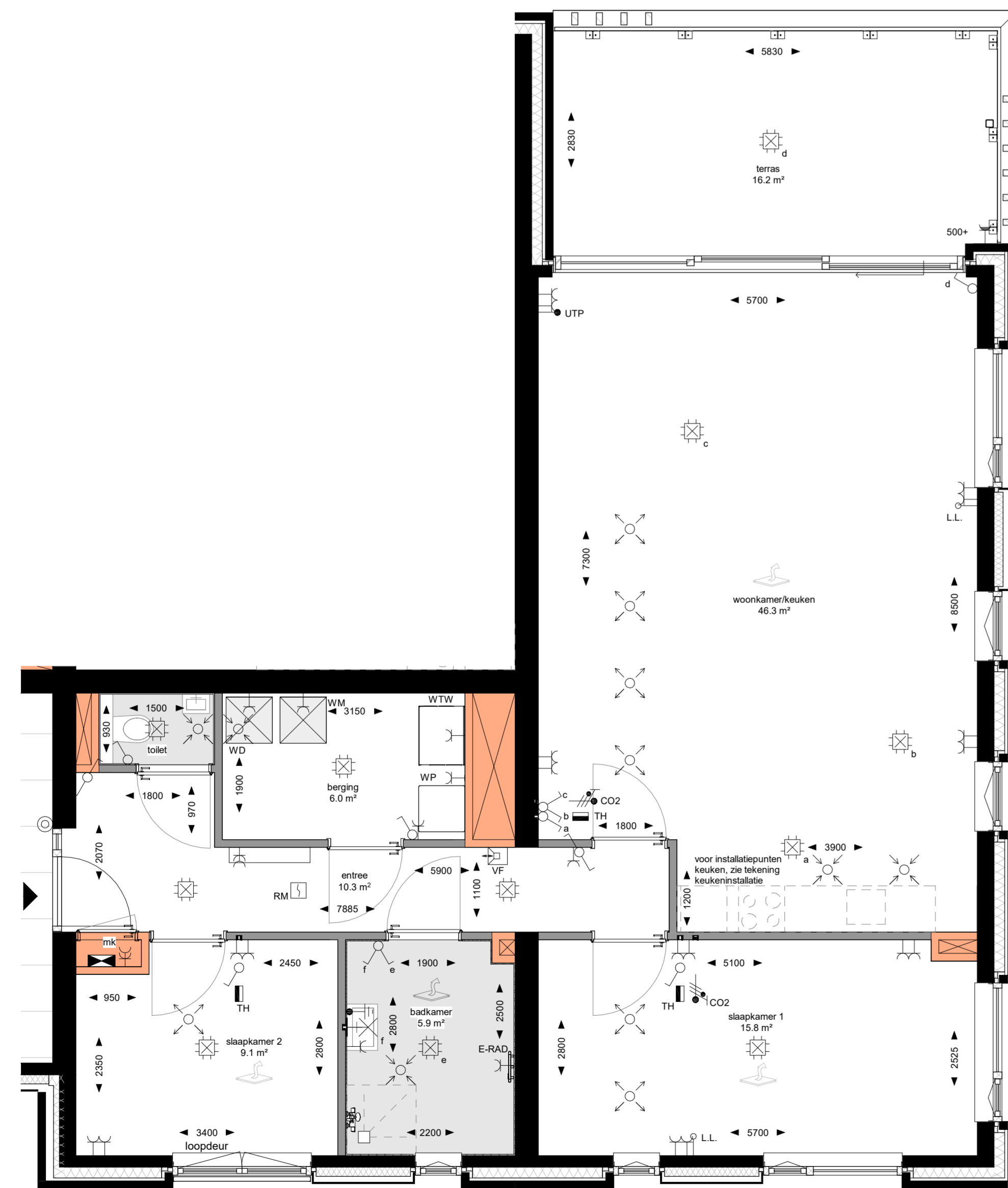
Tweede verdieping 1:50