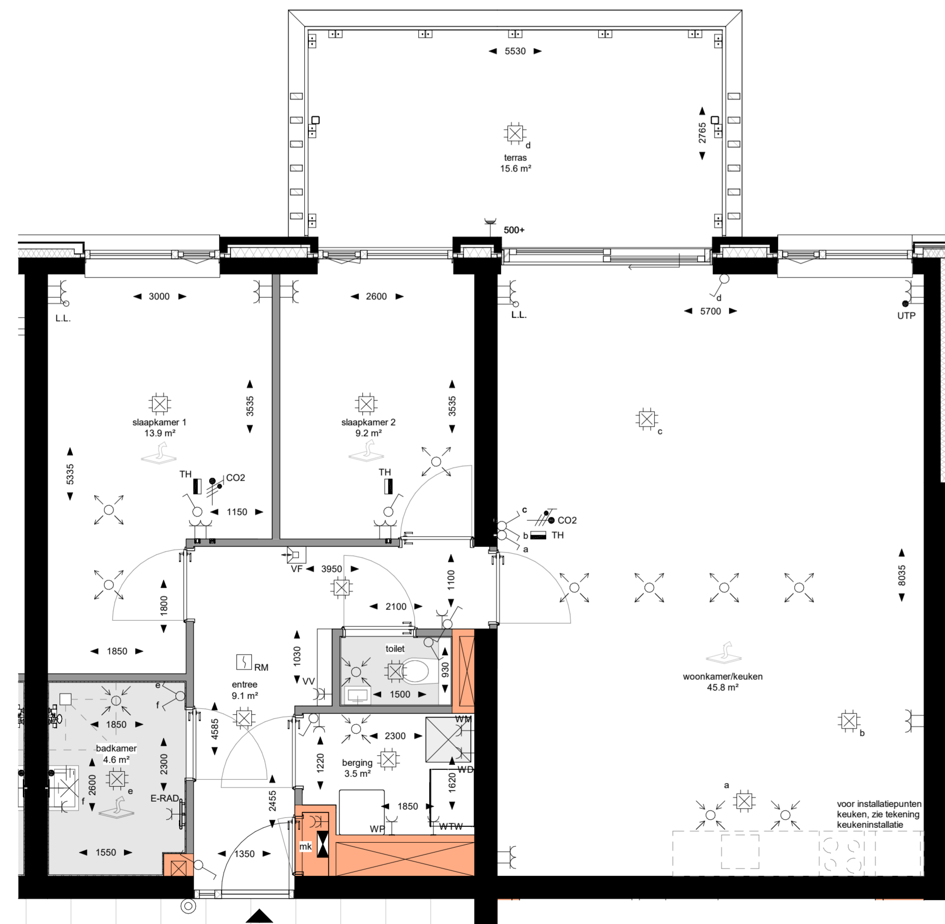
Eerste verdieping 1:50