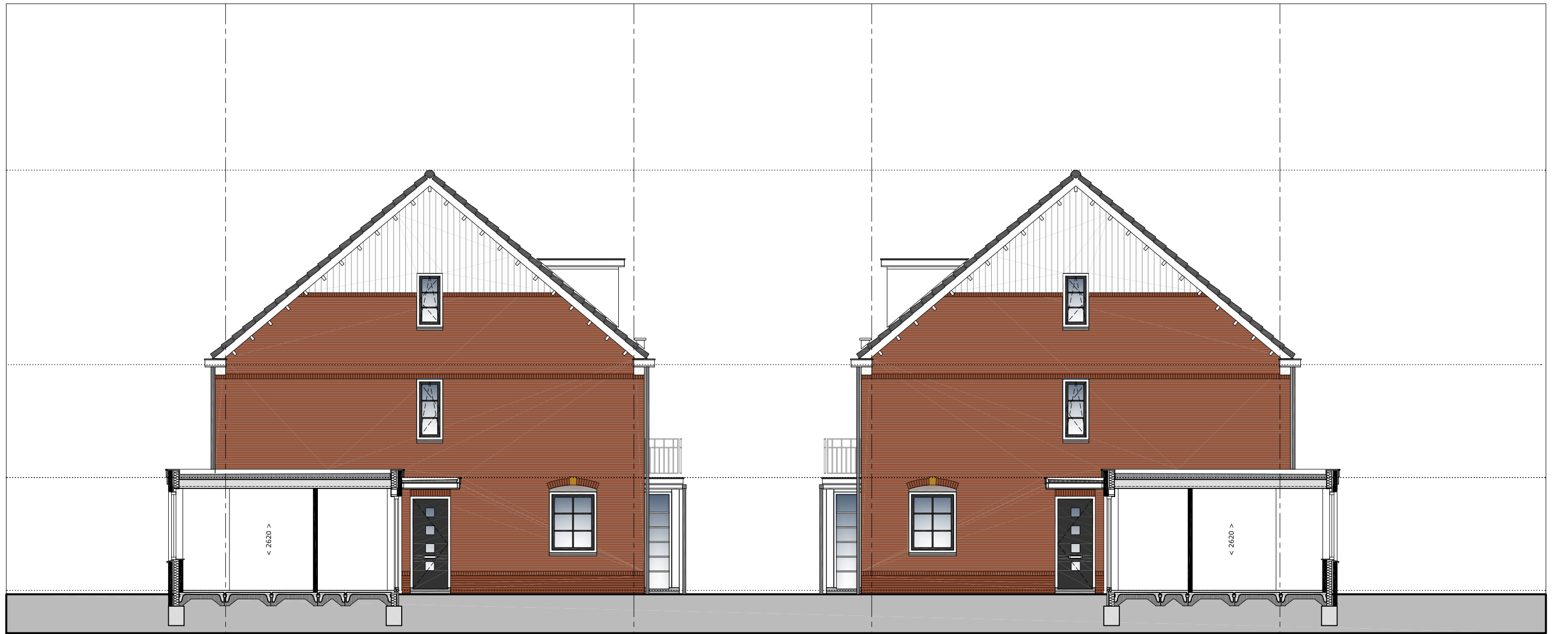
bwnr 67-70-74-78 type 2L3s