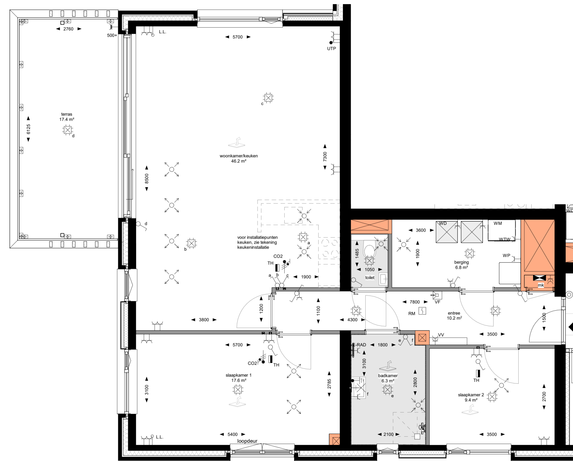
Eerste verdieping 1:50